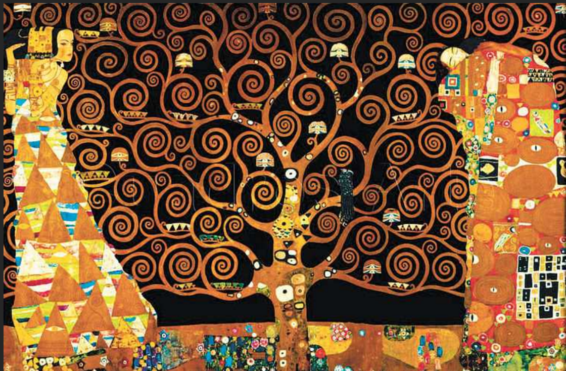
El árbol de la ciencia (1909). Gustav Klimt